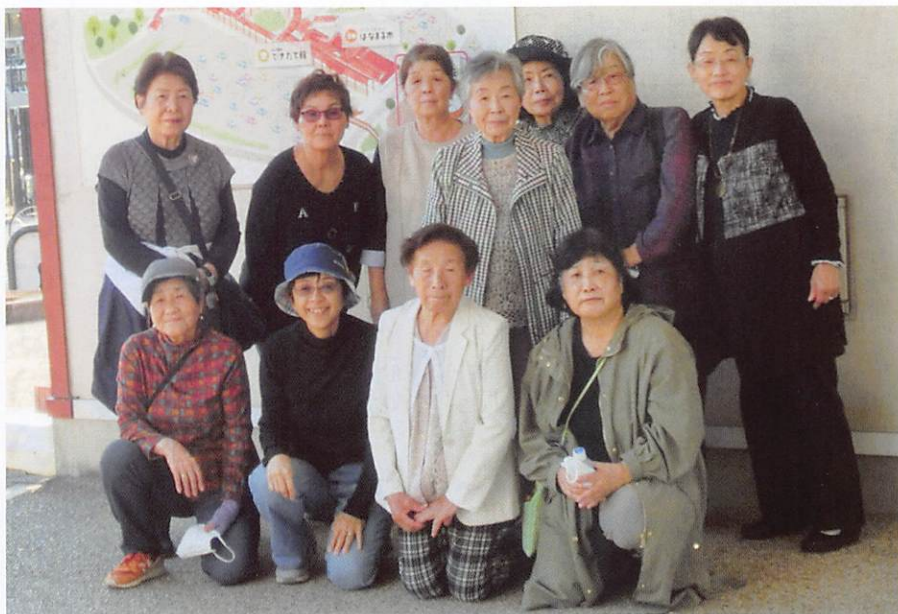
「げんきの郷」で。参加された皆さんは親睦を深め、一日楽しんだようです。

■日時/令和6年11月12日(火) ■会場/あいち健康の森健康科学総合センター あいち健康プラザ