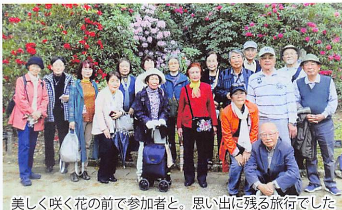
美しく咲く花の前で参加者と。思い出に残る旅行でした

無精者は三日坊主で何度も挫 折しました。でも、最近続い ていることがあります。それ は一日の生活の中で、例えば 朝、顔を洗う時に膝を曲げず に洗う。食事をする前に両手 を上げて背伸びをする。食事 が済んだら首を2〜3回まわ す。テレビを見る前には...、 お茶する前に...などなど、10 パターンほど軽運動を実践し ています。最近、そのおかげ で身も心も軽くなったような 気がします。