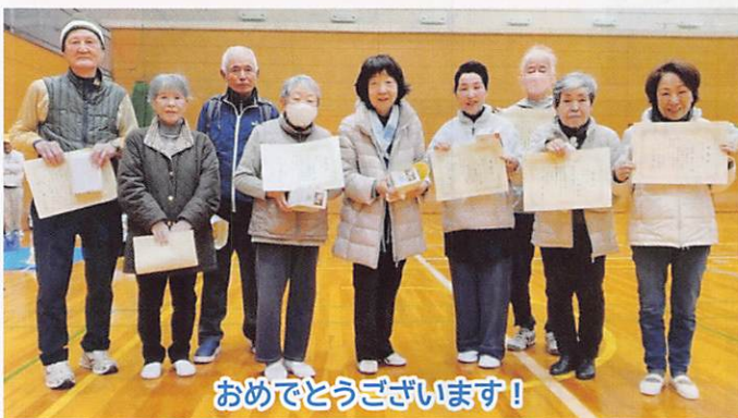
左側の3名が「高見B」、中央3名が優勝の「富士見台」、右側の3名が「高見C」の皆さん