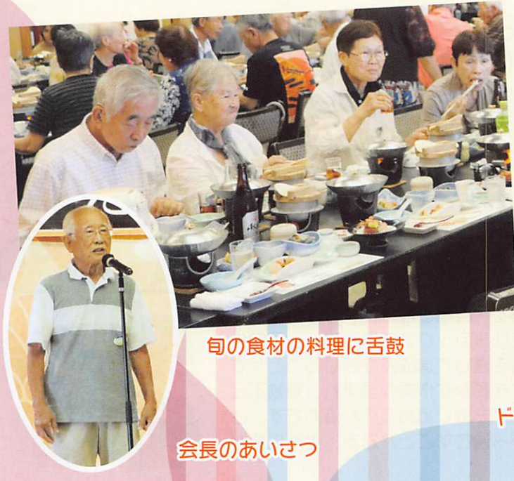
旬の食材の料理に舌鼓

「がん封じのお話が良かったです」「お料理がおいしかった」「また行きたいね」「楽しかったです」などの感想が聞かれる一日になりました。