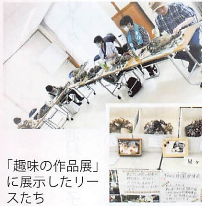
リース作り (写真上・左)