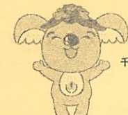
千種区マスコットキャラクター 「こあらっち」