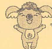
千種区マスコットキャラクター 「こあらっち」